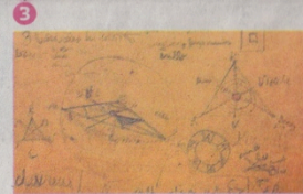
MIRANDA BOSCH MONTEVIDEO 1723 (HASTA EL 27/11) Il disegno

"No sé bien cómo entré en la zona de los circuitos", dice Tulio de Sagastizábal, artista misionero nacido en 1948 y muy resmío. A medio camino entre la comicidad que una forma puede inspirar y la organización de un cosmos, las obras de Meteoro conforman una continuidad alocada, entrecortada por saltos inesperados y estímulos cromáticos. Sobre tela y sobre papel, la manera en que De Sagastizábal utiliza la pintura acrílica es atípica. Los colores respiran, como si la estrategia discursiva del artista confluyera en otra material, animada e hipnótica.