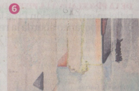
VAN RIEL JUNCAL 790 (HASTA EL 20/11) Escenografías imaginarias

Ámbiciosa exposición temática sobre la percepción que los artistas locales tuvieron y tienen sobre el significado, no sólo emocional y político sino también cognitivo y vivencial, del continente americano. A la vez que se releva un amplio arco temporal, las obras indagan imaginarios, identidades y agendas vinculadas con el continente. Al conocido interés cartográfico de Nicolás García Uriburu, manifiesto en sus mapas reorientados y en sus paisajes de los que brotan puños o rostros, se suman las investigaciones sobre viajeros y representaciones de Leandro Katz y Leonel Luna. Acertado cruce de potencia crítica y estrategias visuales en un recorrido histórico fijado.